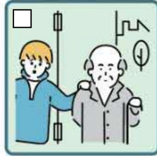
目を離せない家族の見守りや声かけなどの気づかいをしている