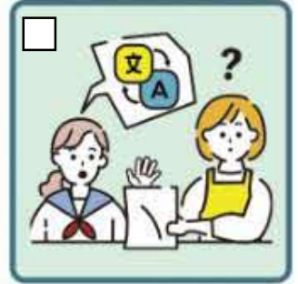
日本語が第一言語ではない家族や障がいのある家族のために通訳をしている