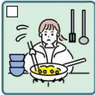
障がいや病気のある家族に代わり、買い物・料理・掃除・洗濯などの家事をしている