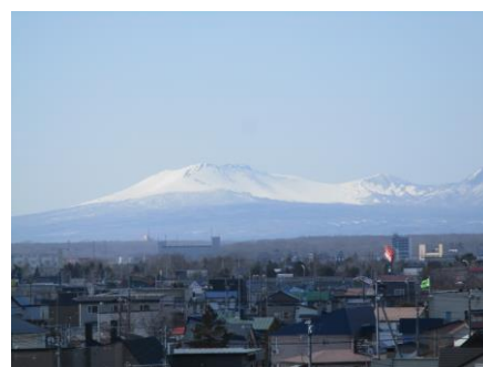
6年生教室から見える樽前山

保護者・地域の皆様、これからも感染症対策を継続し、お体に気を付けてお過ごしください。1年間、ご理解ご協力をいただきありがとうございました。