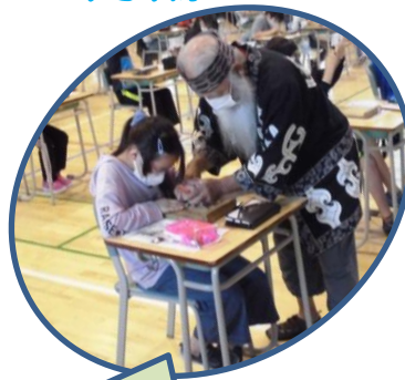
6年アイヌ文化学習 ムックリ作り・アイヌの歴史