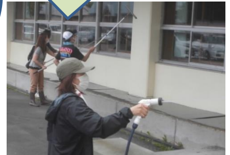
PTA 環境整備作業 1階窓とトイレ清掃をして頂きました