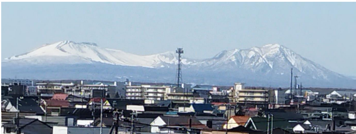
屋上から望む樽前山と風不死岳

給食配膳員として末広小学校でお世話になります。児童の皆さんが笑顔で安心・安全に給食の時間を楽しんでもらえることを願っています。どうぞよろしくお願いいたします。