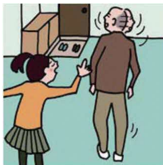
目を離せない家族の見守りなどのケアをしている