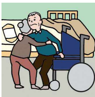
健康不安を抱えながら高齢者が高齢者をケアしている