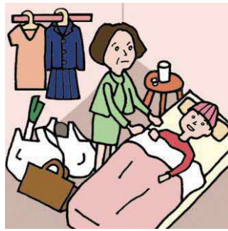
仕事と介護でせいっぱいでほかに何もできない