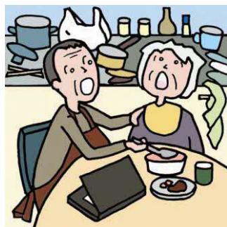
仕事を辞めてひとりで親の介護をしている