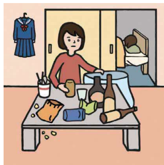
アルコール・薬物・ギャンブル問題を抱える家族に対応している

© 一般社団法人日本ケアラー連盟 / illustration : Izumi Shiga