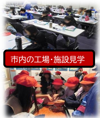
市内の工場・施設見学