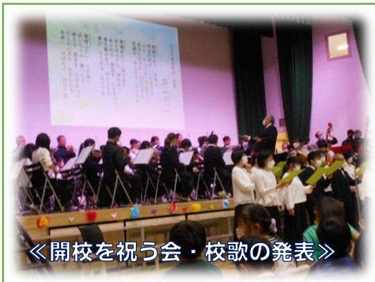
《開校を祝う会・校歌の発表》

年の暮れが近づいてきました。明日から子どもたちは冬休みとなります。振り返ってみると、あっという間に時が過ぎたように感じています。4月からの教育活動を順調に進めることができたのは、保護者・地域の皆様のご理解・ご協力の賜物と考えております。本当にありがとうございました。