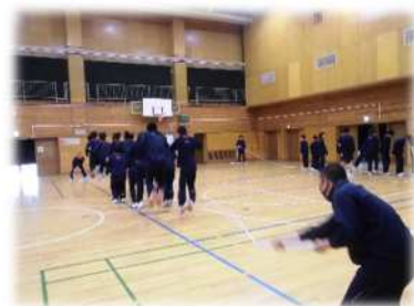
「みんなでジャンプ」の練習の様子