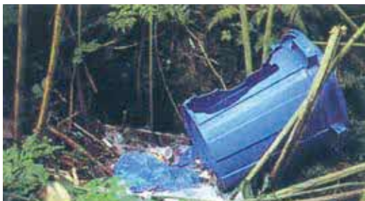
ヒグマに荒らされたゴミバケツ

実際に平成11年～21年度に渡島半島地域で銃器によって捕獲されたヒグマ586個体の胃袋を分析した結果、7.0%に当たる42個体からゴミ袋が出現しました。