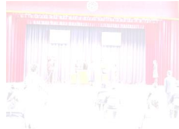
第38回卒業証書授与式

「竹は節があるから伸びていく」という言葉あります。人も竹と同じように節目があるから成長を感じ、次の節目に向かって成長するものだと思います。子どもが節目を感じずに通り過ぎてしまえば、成長を自覚する機会を失ってしまいます。この3月を大切に、ご家庭で子ども達の1年間の頑張りや成長を話し合い、次の学年への希望や目標、意欲をもたせる機会にしてほしいと思います。この1年、保護者の皆様をはじめ地域の方々、学校関係者の皆様には様々な場面で本校へのご支援・ご協力をいただきました。ここに、心より感謝申し上げます。次年度もこれからの社会・地域を担う子ども達のためにご支援ご協力をよろしくお願いいたします。