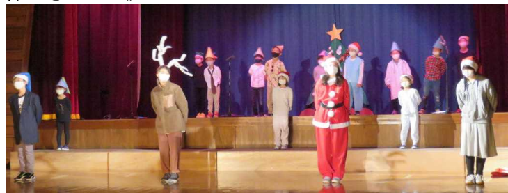
小学校 劇「ある聖夜の物語」

緊急事態宣言が解除となり、10月2日(土)の学校祭は予定どおり実施することができました。コロナ対策を徹底したうえでの実施ということで、演目を工夫したり、椅子の配置を広くしたりしました。子どもたちはマスクを着用したままの発表でしたが、練習の成果を十分に発揮できました。