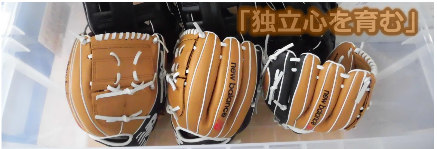
(大谷翔平選手からのプレゼント)