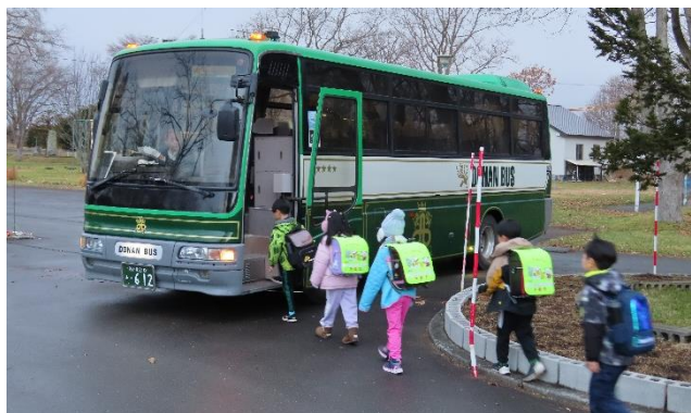
今年度のスクールバスを運行してくれる会社は道南バスさんです。 TEL 0144-55-7125

1日の運行開始日から、児童生徒たちは、運転手さんに対して「おはようございます」「ありがとうございました」と元気よく挨拶ができています。運転手さんは、乗車前の確認と降車後の確認を行うなど、児童生徒たちが安心安全に利用できるようにしてくれています。大変ありがたいことと思います。児童生徒たちも、自ら安全に乗降車できるようにしてほしいと思います。