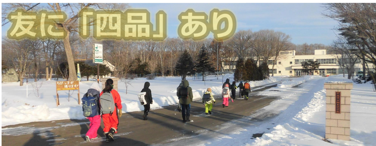
(小学生と中学生が共に歩く、登校のようす)