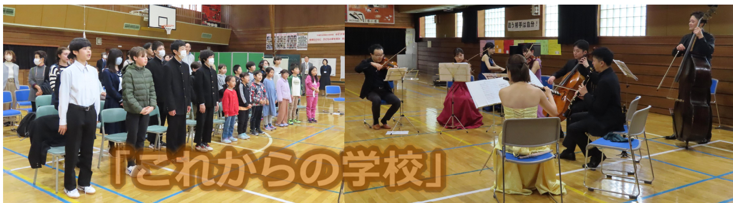
(11月2日 サロンオーケストラ∞コンサートで、オーケストラの演奏により校歌を斉唱)