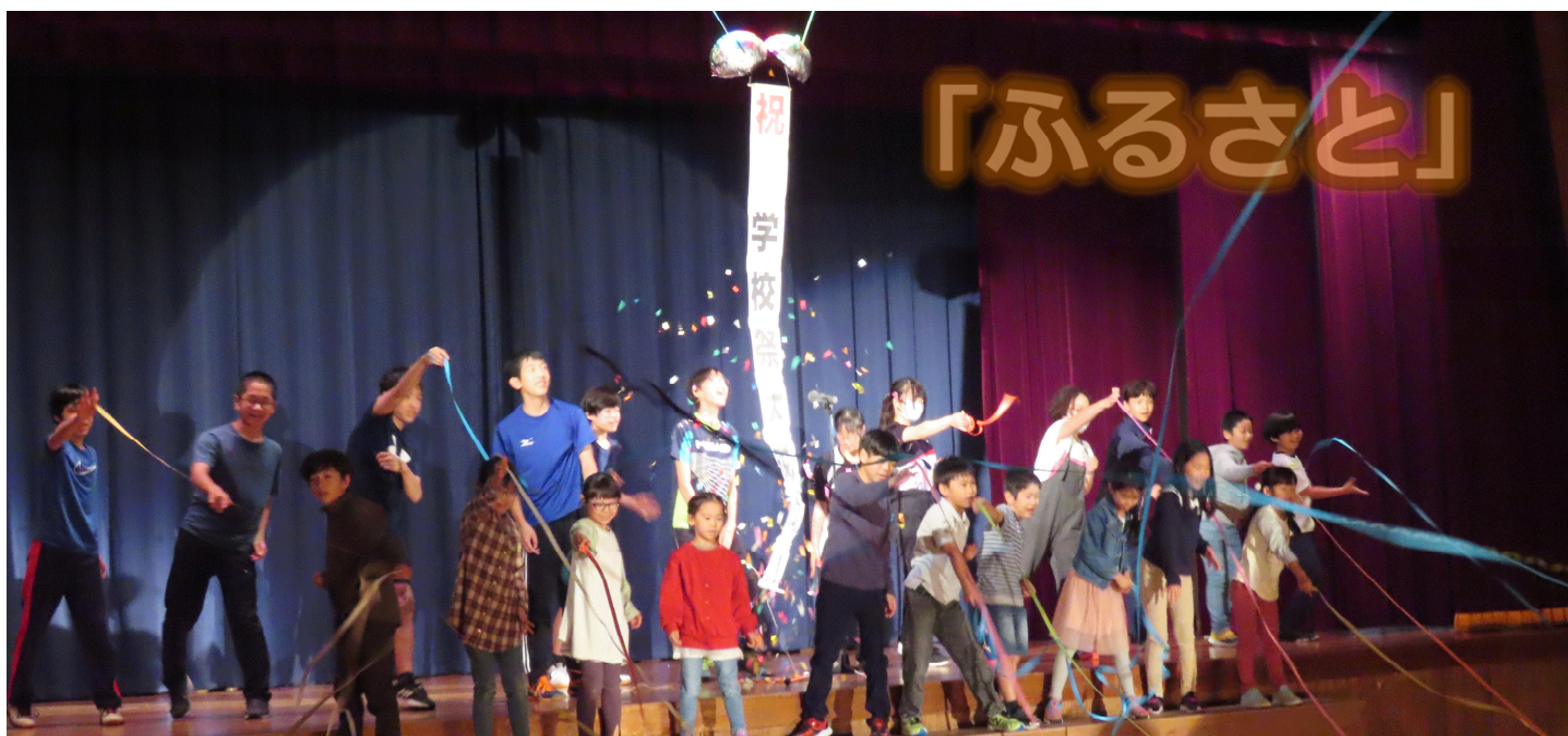
(令和5年度「学校祭」フィナーレ)