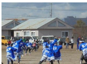
【全校よさこい(6年生)】