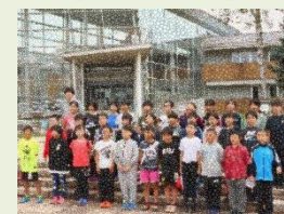
【ネイバル深川にて】