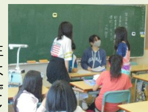
【生活委員会の活動の様子】

4年生以上が活動する児童委員会がスタートしました。15日には、委員長などの役決めや、全校児童が豊かな学校生活を送ることができるよう、それぞれの委員会で行えることについてアイデアを出し合いました。