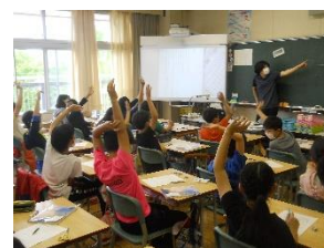
【5年生の道徳科の授業】

本校は、子供たちにこれからの社会をよりよく生きていくための人間性等を身に付けさせることを目的に道徳科の実践に重点をおいています。5年生では、「感謝の言葉（ありがとう）は、なぜ大切なのか」をテーマに授業を進めました。子供たちは、「感謝の気持ちを言葉によって伝えることが大切だから」、「お互いにうれしい気持ちになれるから」など、自己を見つめながら自分なりの考えを伝え合うことができました。