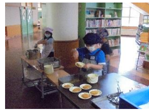
【2年生の盛り付け作業の様子】