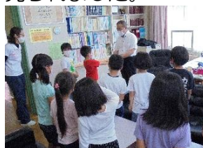
【校長先生に感謝状を贈る2年生】

また、校長先生は、2年生の盛り付け作業を行っていましたが、職員の盛り付け最終日に、2年生の子供たちから感謝の気持ちを込めた手紙が贈られるという、うれしい場面が見られました。