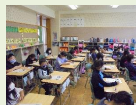
【問題を解いている3年生】

26日に、2年生から6年生の学力検査がありました。本調査の結果から子供たちの課題を明確にし、今後は、子供たち一人一人の学力向上に向けた具体的な取組を進めていきます。