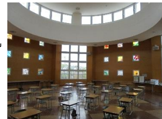
【1年生が学習する2階ホール】

これまで使用していた1年生教室の机と椅子を2階ホールに運び、間隔を十分にとり並べました。早く環境に慣れるよう配慮していきます。