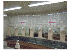
【一方通行の水飲み場】

学校が再開しました。子どもたちは、元気に登校し、久しぶりの学校生活を楽しんでいました。本日、校長先生から校内放送を通じて「学校の新しい生活様式」についてお話がありました。子供たちはもとより職員も、早く慣れていきたいと考えています。