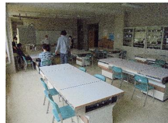
【3年生が学習する家庭科室】

家庭科室の机や長机を利用し整備しました。また、児童用の椅子を互い違いに配置し、児童が対面して学習することを避けました。