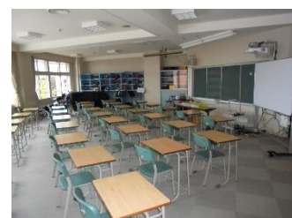
【5年生が学習する音楽室】

音楽室にあるほとんどの楽器を教室外に運び出し、スペースを確保しました。扇状に机を配置することで間隔を十分とることができました。