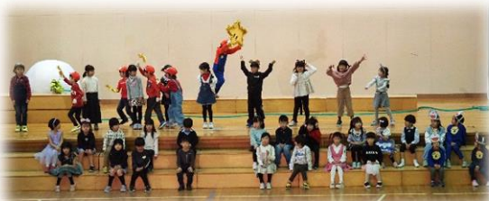
1年生「おおきなかぶ」