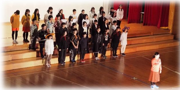
6年生「夢から醒めた夢」

11月7～9日の日程にて、学芸会を実施致しました。それぞれの学年が、器楽演奏や劇などに挑み、仲間とともに学んだことを生かして頑張りました。