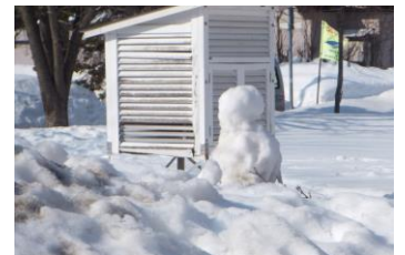
2年生が作った雪ダルマさん、お日様を浴びて小さくなってきました

明日から、子どもたちが楽しみにしている春休みです。感染症対策を継続し、元気に過ごしてほしいと思います。また、雪解けが進みますので、春型の事故にも十分気をつけ、4月1日の進級を迎えることを願っています。