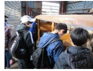
【赤平炭鉱ガイダンス施設】