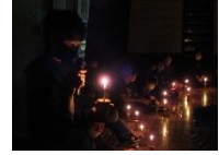
【ネイハバル「夜の集い」】