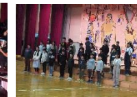
【6年：カミカミマン他】