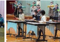
【3年：イマジネーション】