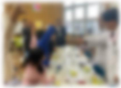
3年生「デンソーサイエンススクール」

12月18日（月）に、3年生が「デンソーサイエンススクール」を受講しました。経済産業局の主催にて、千歳の子どもたちにもっと科学を知ってもらおうという主旨の取り組みです。講師には、デンソー北海道の皆様が担当くださり、電磁石やモーターの実験などを通して、子どもたちへ科学の楽しさを伝えてくれました。3年生は、走るリニアモーターカーの模型を見たり、発電の実験を体験するなどして、主体的に学ぶことが出来ました。