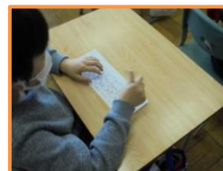
【教室での投票の様子】