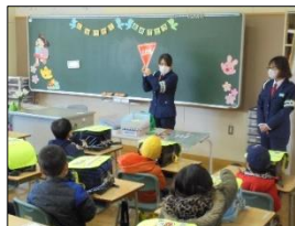
【交通安全教室の様子】

道路を横断する時は、「手を挙げて、左右を確認して渡りましょう」など子どもたちが安全に登下校することができるよう教えてもらいました。ご家庭でも、ご指導お願いします。