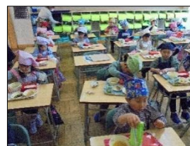
【初めての給食の様子】

4月13日、待ちに待った給食がはじまりました。豚肉の生姜焼きやもやしの味噌汁など、みんなでおいしくいただきました。