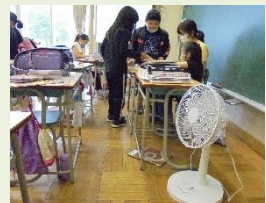
【教室に設置された扇風機】

市教委の予算で、各教室2台の扇風機が設置されました。今年度は、ご承知の通り夏休みが短く、また、コロナ対策でマスク着用が基本となっていることから、有効に活用していきます。