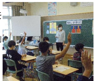
【6年生の食育の授業】

7月22日(水)に、6年生を対象とした授業が行われました。千歳市学校給食センターから3名の栄養教諭を迎え、「好き嫌いをしないで栄養のバランスよく食べること」「食べ物を大切にす感謝の心を持つこと」等について学びました。