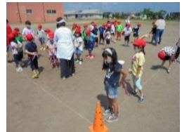
【しっぽ取りゲームを待つ1年生】

前期の児童会書記局は、「 楽園~みんなが楽しいと思える学校~ 」を目標に、7月20日に表面で紹介した「しっぽ取りゲーム」を企画運営しました。