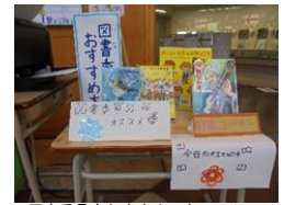
【図書委員会おすすめの本コーナー】

また、図書委員会では、「 みんなにいろいろな本を読んでもらうようがんばる 」を目標に、おすすめの本コーナーを設置したり、読書イベントに使う景品作りなどに取り組んだりと積極的に活動を行っています。