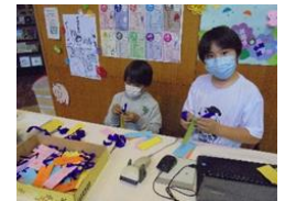
【図書委員会の活動】