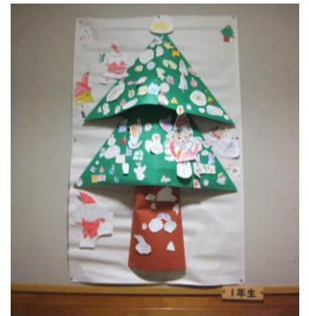
「まちのぞんでいた冬コンテスト」より

12月は冬を元気に過ごすことを目的として児童委員会主催の企画が行われました。体育委員会の「かべタッチリレー」や掲示委員会の「まちのぞんでいた冬コンテスト」では、全校児童が楽しく参加できました。安全面に気をつけて生活するよう、生活委員会では2週間にわたり廊下歩行点検を行いました。また、教室の換気・マスク着用についても、日常的に各委員会が中心となって呼びかけをしています。子どもたちが主体となって学校生活について考え、みんなが協力することを通し、それぞれの学年に応じた心の成長や個々の成長が見られます。