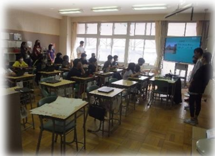
6年生参観授業の様子

次回は、2月での実施を予定しております。近くなりましたら、改めてご案内申し上げます。