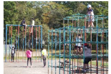
<日常的な外遊びの様子>

空気が澄み切った秋、心地よく体を動かすことにとっても良い季節です。体を動かす機会を増やすために、休み時間に元気いっぱい外遊びをする泉沢小学校の子どもたちを見習って、私もたくさん外に出ようと思います。また、読書の秋で豊かな心づくり、食欲の秋で健康な体づくりを進め、一石二鳥ならず、一石三鳥の秋を味わいたいと思います。