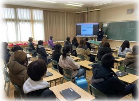
2年生学級懇談会のようす

来校時の感染症予防にご協力をいただいております。引き続きよろしく願いいたします。