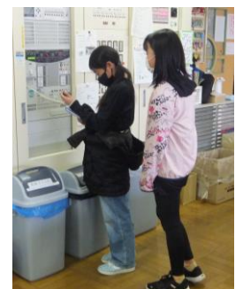
児童委員会による 注意喚起の校内放送