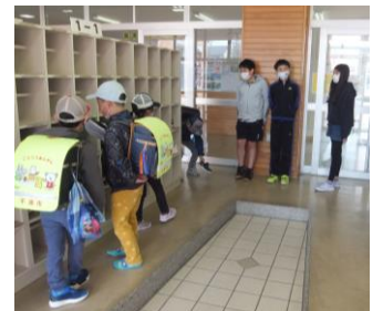
6年生による朝のあいさつと見守り

ともに、規則正しい生活習慣の徹底についても、子どもたちと今一度ご確認ください。あわせて、ネットトラブルや交通安全につきましても子どもたちへの指導やご家庭でのルールの確認をお願いします。家庭・学校の双方がかかわりながら安全な生活環境をつくっていきましょう。