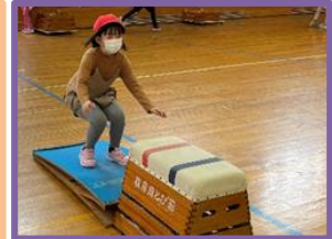
【2年生：体育】 跳び箱に挑戦！