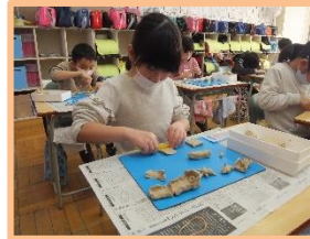
【1年生：図工】 粘土って楽しいな

感染防止の対策を取りつつ、教えるべき内容は確実に指導しており、子どもたちも生き生きと活動しています。各学年の様子を紹介します。