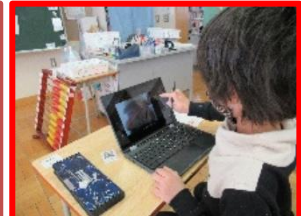
【かがやき：パソコン】 サクサク使いこなしています