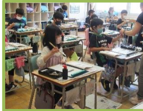
【3年生：書写】 姿勢がすばらしい！