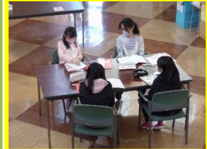
【4年生：国語】 間隔十分にグループ作業！