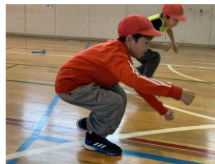
正座から片足で立つ