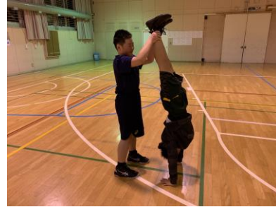
補助倒立（30秒から1分静止）