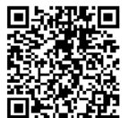
北海道 新型コロナウイルス 療養解除日カレンダー