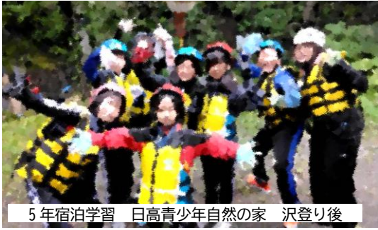
5年宿泊学習 日高青少年自然の家 沢登り後