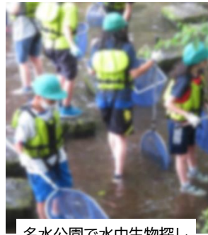
名水公園で水中生物探し

4年生の総合的な学習と社会科では、千歳市の「水」について学習しています。7月5日(火)には名水公園へ、7月20日(水)には支笏湖ビジターセンターへ行き、千歳の清らかな水について体験的に学習しました。様々な生態や歴史も学び、千歳への愛着をさらに深めていました。