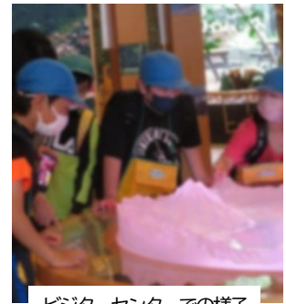
ビジターセンターでの様子