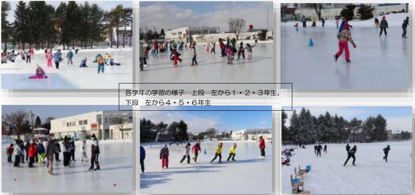
各学年の学習の様子 上段 左から1・2・3年生、 下段 左から4・5・6年生

特に低学年では、自分で準備や片付けができるよう、外で学習する前に体育館で、靴の脱ぎ履きや歩行などを行いました。