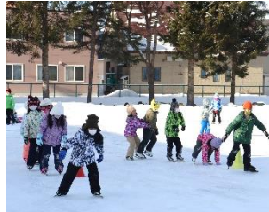
2年生のスケート学習の様子