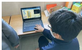
プログラミングをする4年生