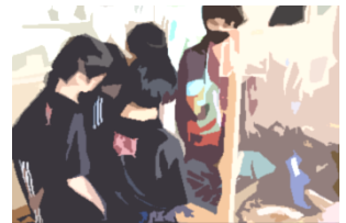
冬休みの作品を見る6年生

各教室前に展示された作品も、時間をかけて丁寧に作られており、素晴らしい作品ばかりでした。