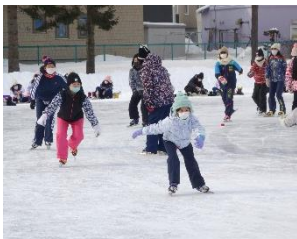
5年生のスケート学習の様子

リンククローズは2月20日(月)となります。放課後や土曜・日曜にスケートに親しみ、楽しんでほしいと思います。