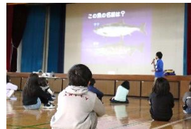
サケについての説明を聞く3年生

1月23日(月)、3年生が千歳水族館の方から、サケの孵化についていろいろ教えていただきました。そして、サケの受精卵をあずかり、3月までふ化を見守ります。