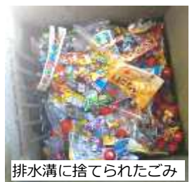
排水溝に捨てられたごみ

また、おごる・おごられることにかかわるトラブルも続きました。金銭トラブル・交友トラブルのもとになりますので、 おごったり、おごられたりしない よう、お子さんに注意をしてください。