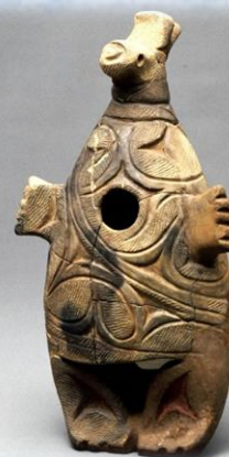
「動物形土製品」（ビビちゃん） 全長 31.5cm 重さ約 1kg アザラシなのか亀なのかそれとも水鳥なのか。この日、本物はウポポイに貸出中でした。