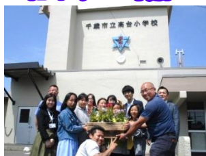
【大鎮キムラ建設株式会社から寄贈】