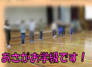
あさがお学級です！