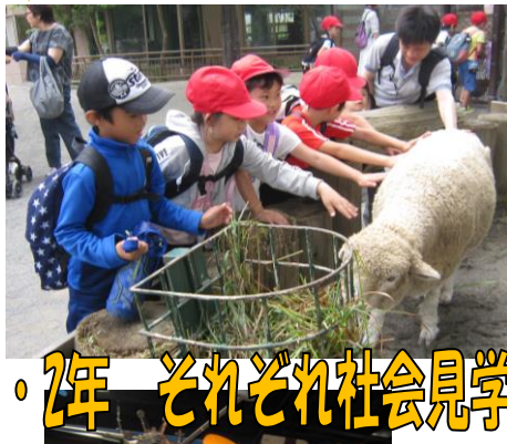
1・2年 それぞれ社会見学へ