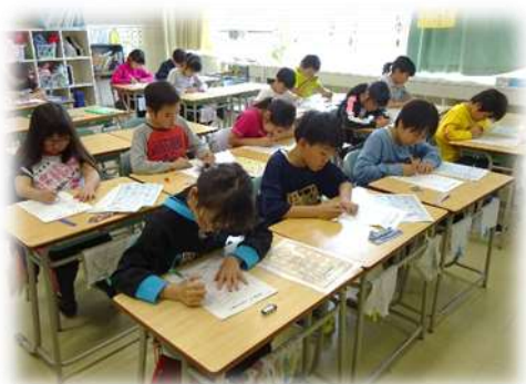
昼勉に集中して取り組む 4 年生

月～朝読書 火～国語の学習 水～朝読書 木～算数の学習 金～100問計算プリント