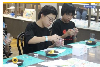
修学旅行 小樽の北一硝子にて

6年生の修学旅行を皮切りに夏休み明けから続いた校外での体験学習は、5年生の宿泊学習をもってすべて終了しました。私は修学旅行に引率しましたが、リーダーを中心にみんなで協力し合う姿が多く見られ、集団の中で自分の役割を考えて行動することができていました。すべての学年がそれぞれのねらいを十分に達成できたと感じています。保護者の皆様のご理解とご協力に感謝申し上げます。