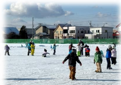
1年生 はじめてのスケート学習

1月10日、市内のスケートリンクの中で一番初めにオープンした千歳第二小のスケートリンク。オープンをマチコミメールでお知らせしたところ、早速スケートを楽しむ子どもたちの姿が見られました。16日からは授業も開始しました。市のボランティアに登録していただき、授業の支援をしてくださっている保護者の方、登録はしていないものの、毎時間のように靴紐しばりの補助に来ていただいている保護者の皆様、本当に感謝しております。